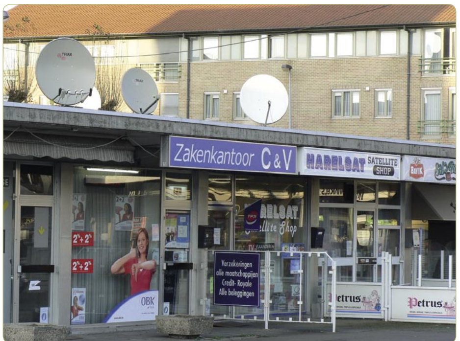
A kis Harelsat üzlet – nyitvatart keddtől szombatig reggel 9-től délután 5 óráig és amely komplett műhold csomagokat kínál.

kiállításokat, amelyek közül a legutóbbi több mint 10 kiállítót vonzott 2006-ban – ideértve a műhold és kábel fenntartókat – és 500 látogatót. Egy újabb vásár 2007 májusára van előrelátva, ezúttal legendó helyet fog biztosítani 20 kiállító számára. Mindez azt mutatja, hogy bár Belgium kis piacnak számít, de ennek ellenére nagyon aktív a műholdas téren.