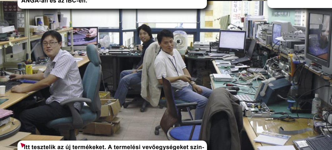
▼ Itt tesztelik az új termékeket. A termelési vevőegységeket szintén itt ellenőrzik hogy biztosak legyenek hogy az előírásoknak megfelelően működnek.