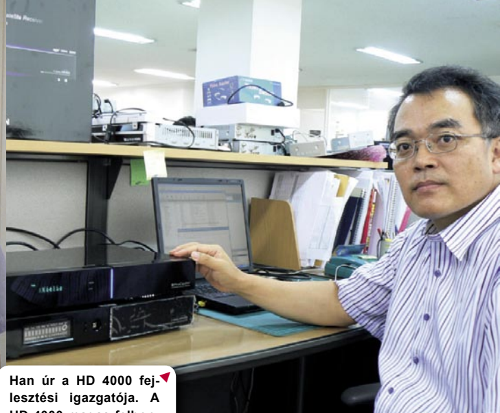
▼ Han úr a HD 4000 fejlesztési igazgatója. A HD 4000 magas felbontású beltéri műhold vevőegység, amelyet bemutatunk a TELE-satellite e számában.