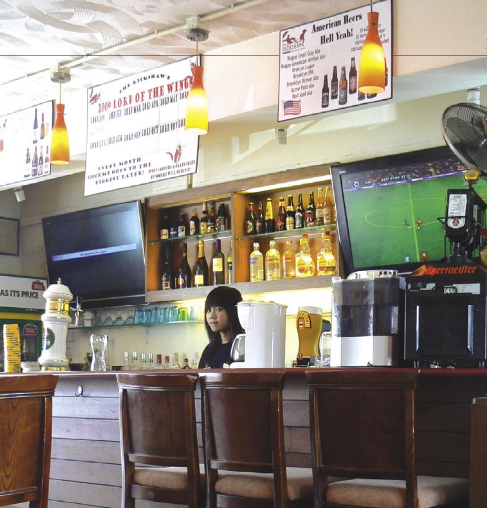
■ A sportprogram állandóan fut a bárban a lapos képernyőn.

■ Ez a Rickshaw bár Pekingben. Shalom Hahn itt négy antennát állított be : az 1,5 méteres tányért a keleti hosszúság 166°-ára, a 2,4 méteres tányért a keleti hosszúság 68,5°-ára, az 1,8 méteres tányért a keleti hosszúság 110,5°-ára és végül a 60 centiméteres tányért két vevőfejjel a keleti hosszúság 138°-ára és a keleti hosszúság 146°-ára.